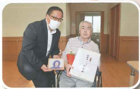
お一人お一人感謝を込めて...