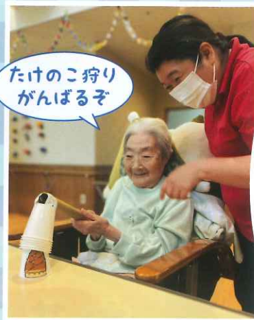
たけのこ狩りがんばるぞ