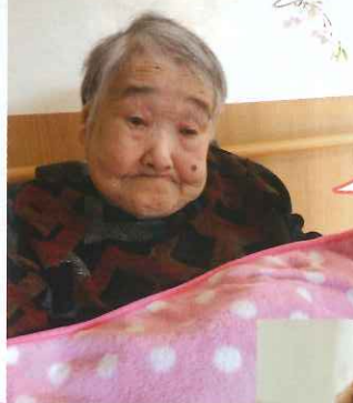
久しぶりに 面会してきたよ♡