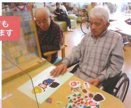
ミニレクも やっています