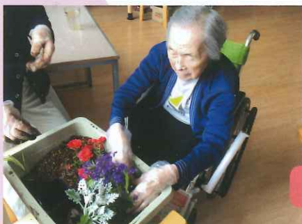
プランターの寄せ植え