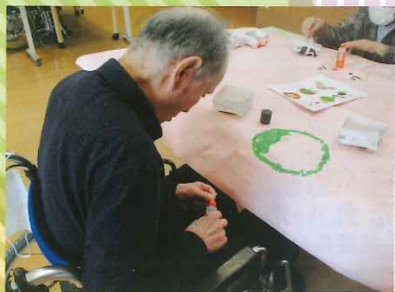
皆で貼り絵スタートです!