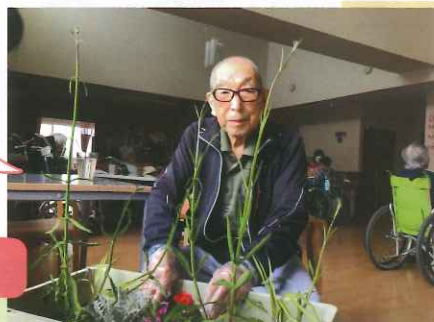
完成したよ どうだい?