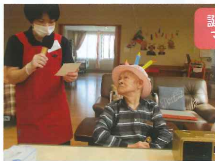
誕生者の紹介です マイクのテスト中