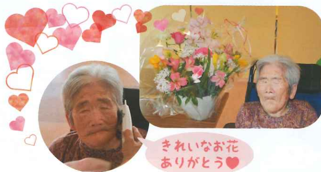
きれいなお花 ありがとう♡