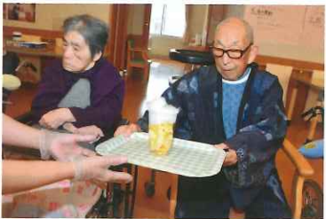
花より団子よりビールでしょ!!