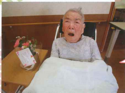
ありがとうございます! うれしいよ!