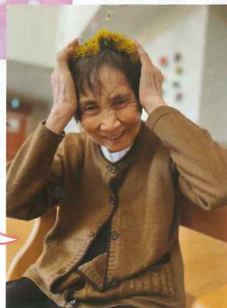
花冠 似合うかしら?